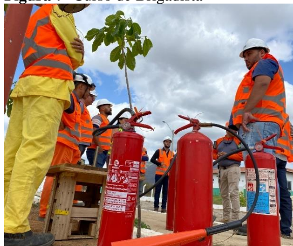
Figura 7- Curso de Brigadista