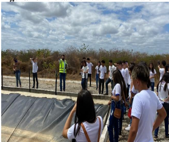
Figura 11- Visita Técnica de Alunos a CTR