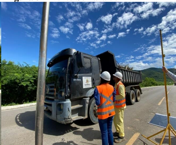
Figura 3- Evento Semana do M.A