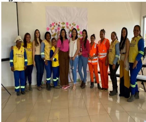
Figura 4- Evento Novembro Rosa