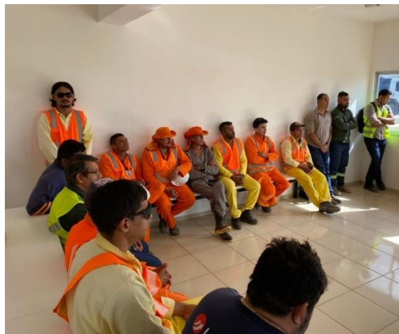
Figura 10- Visita Técnica de Alunos a CTR