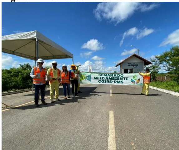
Figura 2- Evento Semana do M.A