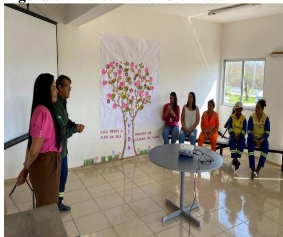
Figura 5- Evento Novembro Rosa