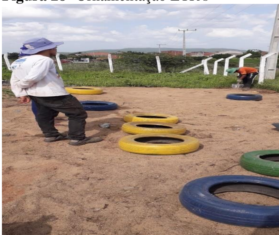
Figura 29- Ornamentação ETR's