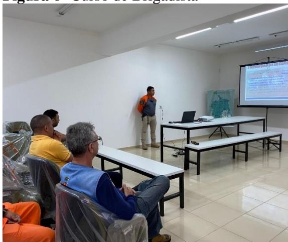
Figura 6- Curso de Brigadista