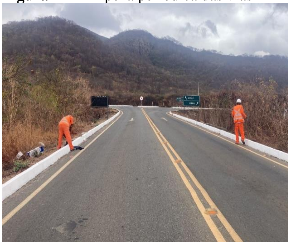
Figura 23- Conserto de cercas ETR's